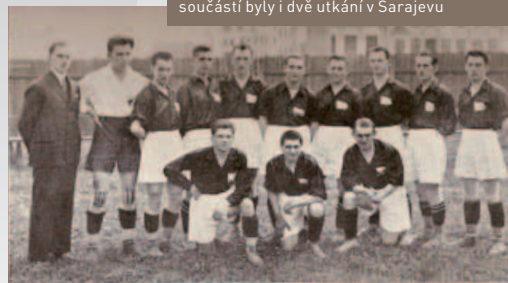
S. K. Viktoria Plzeň, mistr župy 1922-1927.

Viktoria Plzeň v letech, kdy pravidelně vyhrávala župní mistrovství a v roce 1926 absolvovala zájezd do Jugoslávie, jehož součástí byly i dvě utkání v Sarajevu