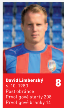
David Limberský 8 6. 10. 1983 Post obránce Prvoligové starty 208 Prvoligové branky 14