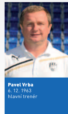
Pavel Vrba 6. 12. 1963 hlavní trenér