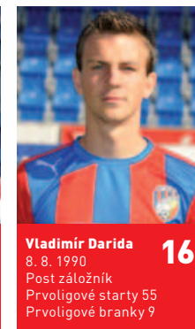
Vladimír Darida 16 8. 8. 1990 Post záložník Prvoligové starty 55 Prvoligové branky 9